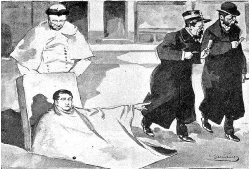
LOS MINISTROS ODONTÓLOGOS, POR GIMÉNEZ

—¡Hasta los dientes me llevan! ¿No tendrán bastante con los propios para comer del presupuesto?