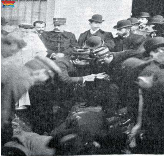
EL MINISTRO DE LA GUERRA EXAMINANDO EL PRIMER HUESO EXTRAÍDO DE LA TUMBA