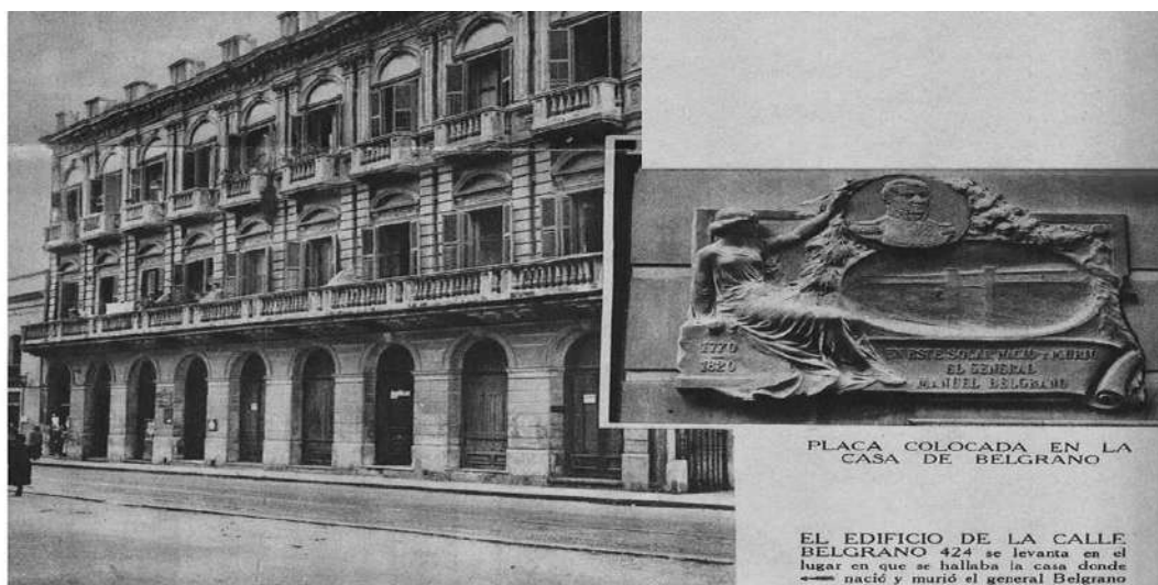
Foto publicada en diario La Prensa en 1938 (fuente: José Luis Cierci).