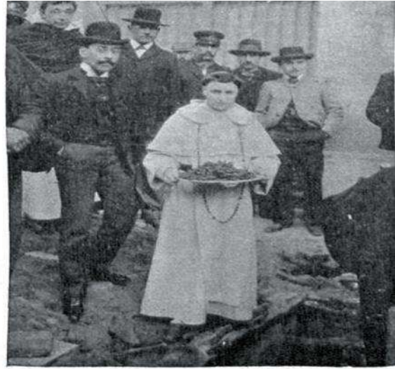
EL PADRE COSTA CON LOS RESTOS DE BELGRANO EXTRAÍDOS DE LA FOSA

Ambas ilustraciones de Revista Caras y Caretas . 13 de septiembre de 1902.